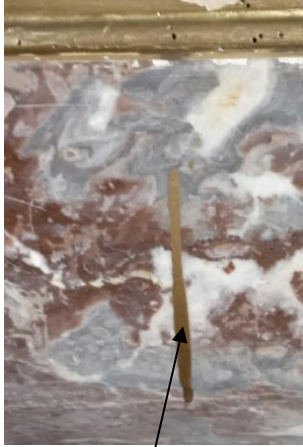
Coulure de peinture dorée

La première étape a été un nettoyage au TAC (triamonium citrate) dilué à 5% et rincé à l'eau déminéralisée sur l'ensemble de l'autel y compris les parties dorées qui sont, en fait, recouvertes d'une peinture qui a été appliquée partout sur la feuille d'or.