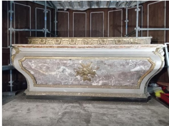
autel après nettoyage

Ensuite, le bois a été traité au xylophène :