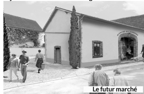
Le futur marché

la réalisation d'ouvertures conformes au style architectural de la région.