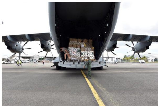
Forces armées aux Antilles : opération de transport de fret international pour l'A400M