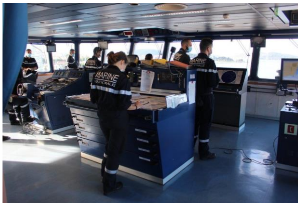
Corymbe : le Porte-hélicoptères amphibie (PHA) Tonnerre en route pour le golfe de Guinée