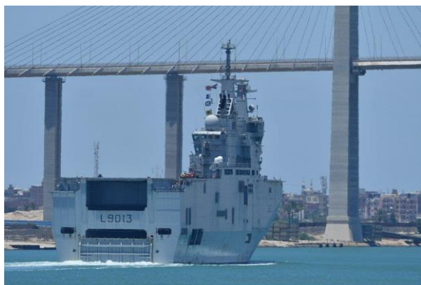
Zone méditerranéenne Atlantique : le groupe Jeanne d'Arc rejoint la Méditerranée